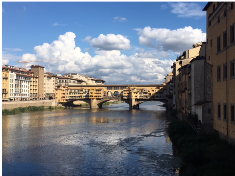
Florença, setembro de 2018